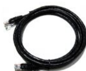
Ethernet Cable x 2