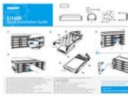
Quick Installation Guide